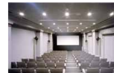
馬車道校舎大視聴覚室