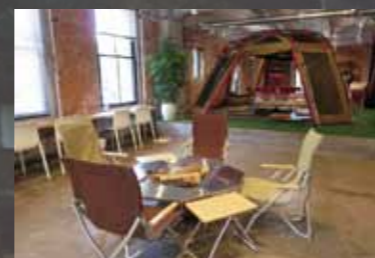
CREATIVE SPORTS LAB

“スポーツ×クリエイティブ”をテーマに、新たな産業の創出を実現する会員制シェアオフィス・コワーキングスペースをはじめ、市民やクリエイターが交流を深めるカフェ、“日常生活に野球をプラスする”ライフスタイルショップ、まち全体をフィールドにスポーツを楽しむ健康で活動的なライフスタイルを創り出すスタジオなどを展開しています。