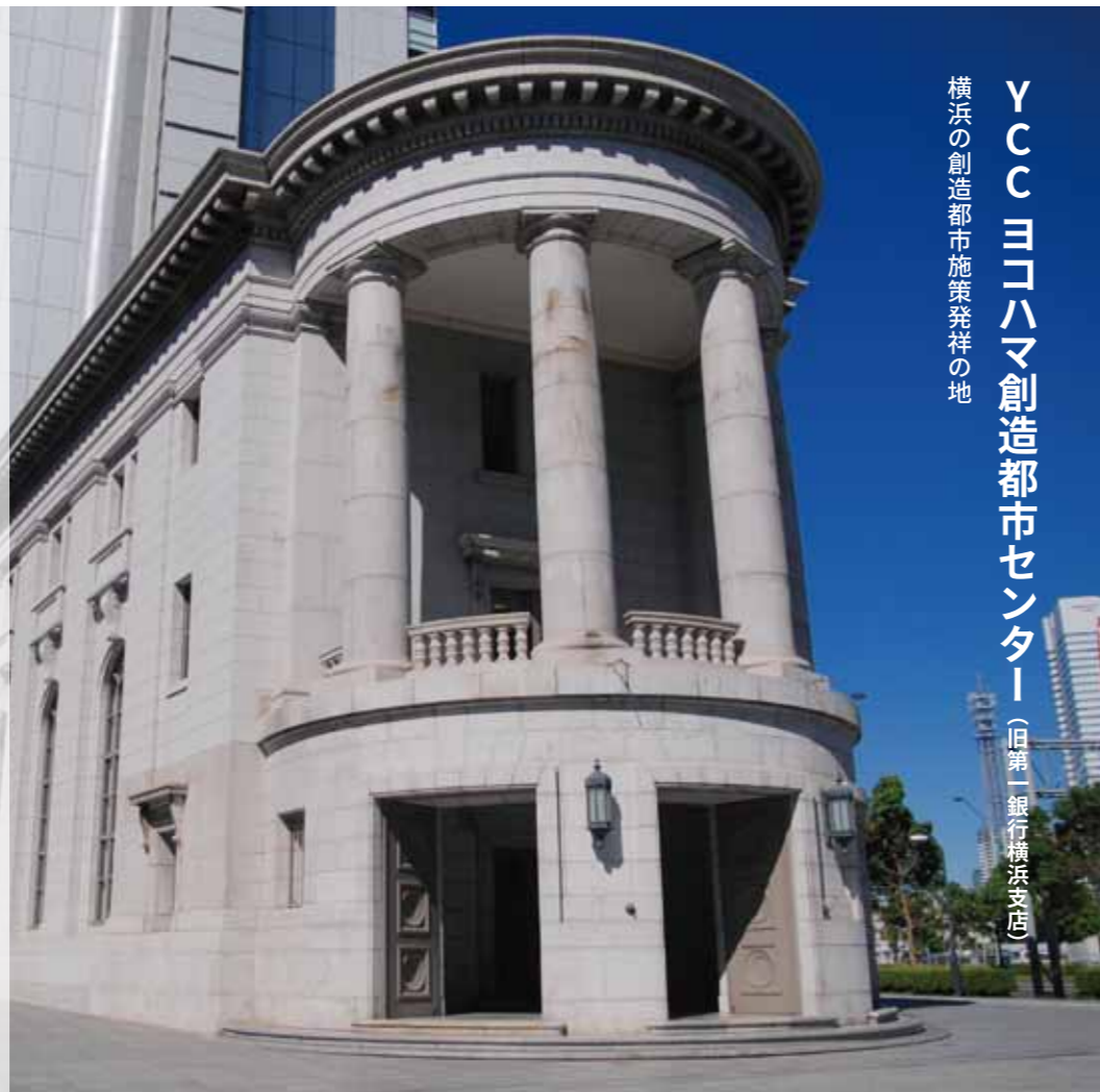
YCC ヨコハマ創造都市センター (旧第一銀行横浜支店) 横浜の創造都市施策発祥の地

象の鼻テラスは、開港150周年を記念し整備された象の鼻パークに、2009年に開館しました。無料休憩施設であると同時に、文化観光交流拠点として、2009年から、株式会社ワコールアートセンターが運営しています。「文化交易」を運営コンセプトとし、世界の港町との文化交流を行うほか、国内外の質の高いアート作品の展示、観光インフォメーション、市民の創造的活動を発表する場の提供などを行っています。象の鼻テラスのプロジェクトとして始まった、スマートイルミネーション横浜(P05)やヨコハマ・パタリエンナーレ(P05)は、横浜を代表するアートプログラムへと発展しています。また、併設のカフェでは、食に関するイベントの開催や、特徴的なメニュー開発に取り組むなど、賑わいを生み出しています。