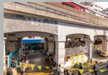
KB2017

かつて、違法風俗営業を行う小規模店舗が250軒を超えていた初黄・日ノ出町地区は、地域、警察、行政が一体となって環境浄化に取組み、2006年の県警による一斉摘発により、違法店舗は閉鎖されました。その後、地域主体で設立された認定NPO法人黄金町エリアマネジメントセンターを中心に、元小規模店舗や京急高架下に整備したスタジオなどをアーティストの制作・発表の場として活用するなど、「アートによるまちづくり」を進めてきました。さらに、国内外のアーティストによるアートフェスティバル「黄金町パザール」などを毎年開催し、地域内外の交流を創出すると共に、地域の魅力を発信しています。こうした取組は、2009年に安全・安心なまちづくり関係功労者表彰「内閣総理大臣賞」、2017年に国際交流基金「地球市民賞」を受賞するなど、高い評価を受けています。