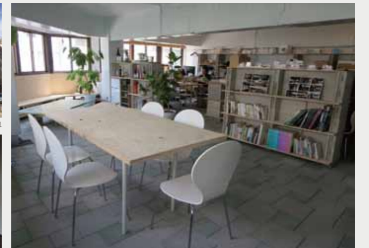
住吉町新井ビル 改修後