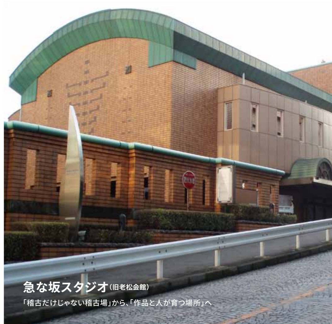
急な坂スタジオ (旧老松会館)