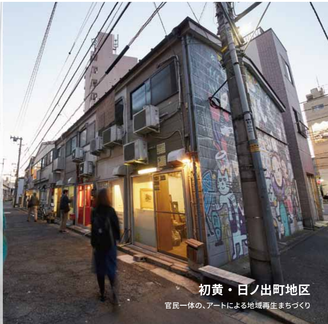
初黄・日ノ出町地区 官民一体の、アートによる地域再生まちづくり