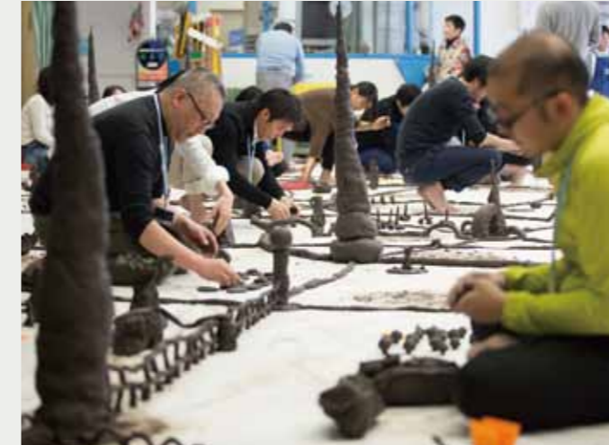
2059 FUTURE CAMP IN YOKOHAMA