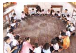
カンボジアでのアート作品制作