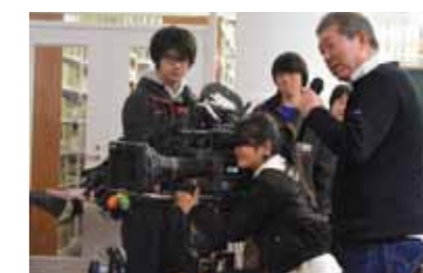
東京藝術大学による地域貢献事業

2004年、旧富士銀行横浜支店は旧第一銀行横浜支店(P01)と同じく、歴史的建造物を活用した芸術文化創造の実験事業の第1号として、「BankART1929 馬車道」となり、歴史的資産を現代に生かす試みが始まりました。その後、2005年に「映像文化都市」の実現を目指して横浜市は東京藝術大学大学院映像研究科を誘致し、映画専攻の校舎(馬車道校舎)として活用されています。映画専攻に続き、メディア映像専攻(新港校舎※その後元町・