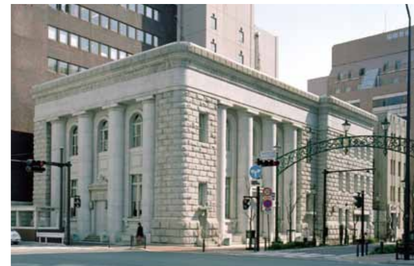
東京藝術大学馬車道校舎