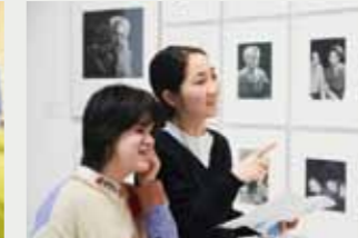
さくたひプロジェクト