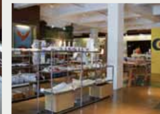
クリエイターグッズショップ

横浜では、市内のアーティスト・クリエイターの活躍の場をひろげ、経済活性化にもつなげるため、アーティスト・クリエイターと企業・地域が連携し、新たなビジネス機会を創出する「創造的産業の振興」に取り組んでいます。2013年にモデル事業を開始し、2016年からは企業の技術力(technic)とクリエイターの創造性(idea)をかけた地域ブランド「texi yokohama」を通じ、付加価値の高い商品開発・販路開拓を行っています。また2018年からは、販路開拓の拡充に向け、様々な産業とクリエイターの創造性を生かした商品を販売するショップの設置・運営を開始しています。