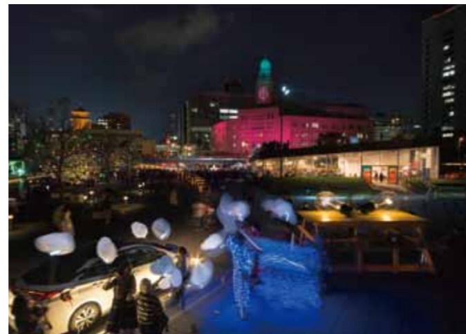
スマートイルミネーション横浜2017