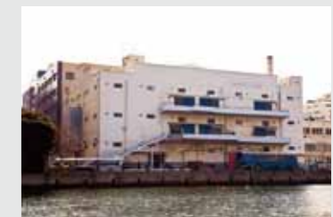
BankART Studio NYK

2004年に実験事業として旧第一銀行横浜支店「BankART1929 Yokohama」(P01)と旧富士銀行横浜支店「BankART1929 馬車道」(P04)がスタート、その後、旧富士銀行を東京藝術大学の校舎とするため、2005年からその機能を海岸通倉庫に移し、ホール、ギャラリー、カフェ等を備えたアートスペースとして活用してきました。現代美術家の大規模個展や、AIRの実施など、先駆的な文化芸術の発信を行い、国内外で活躍するアーティスト・クリエイターを輩出してきましたが、2018年3月に活用終了しました。