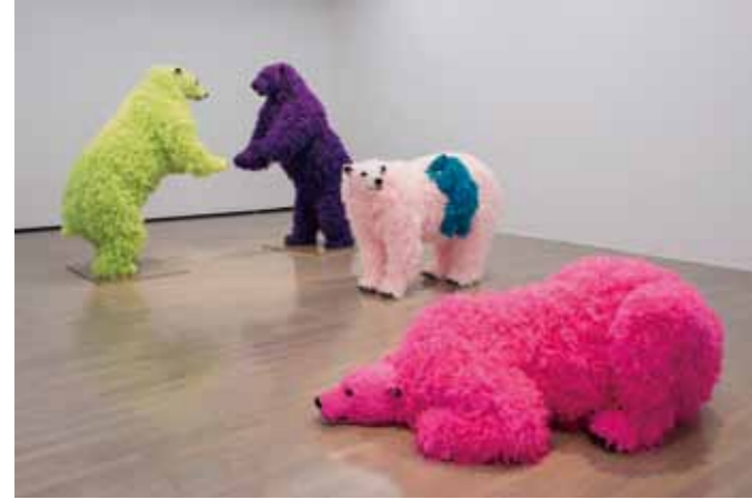
ヨコハマトリエンナーレ2017 パオラ・ピヴィ「I and I (芸術のために立ち上がらねば)」など