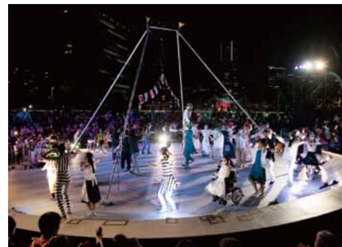
ヨコハマ・パラトリエンナーレ2017「不思議の森の夜宴会」